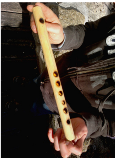
- Traversaine -

Initiation à la facture instrumentale et à la pratique instrumentale